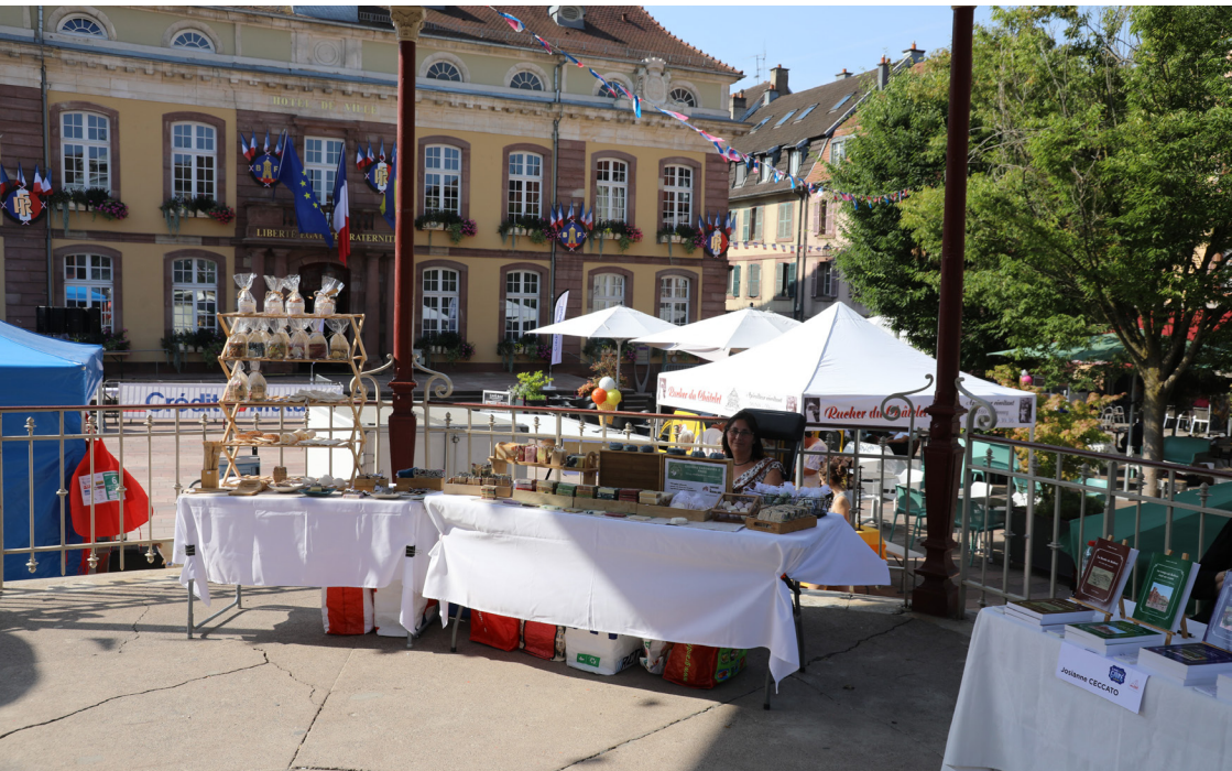
Parmi les artisans le rucher du chatelet