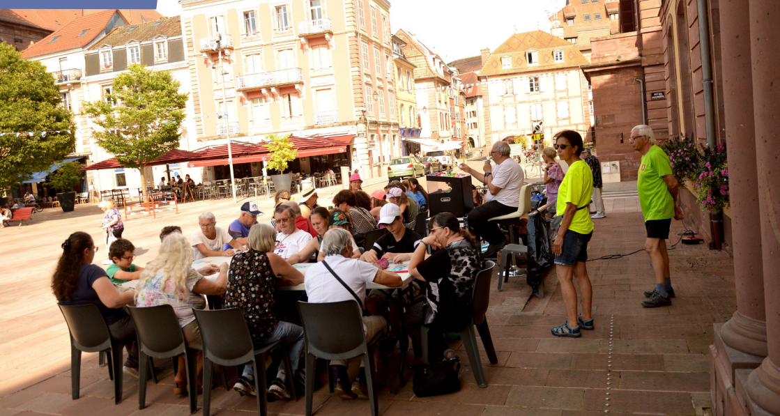
Les bénévoles du Comité des fêtes surveillent le bon déroulement des parties.