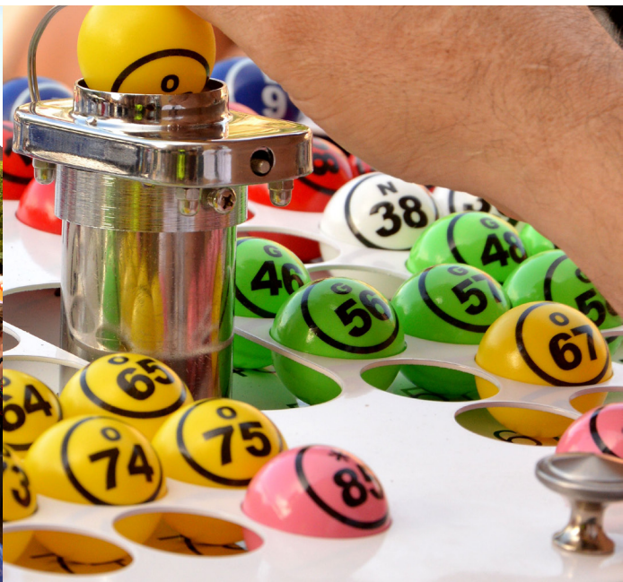
Le tirage des boules est réalisé à l'aide d'un boulleur automatisé.